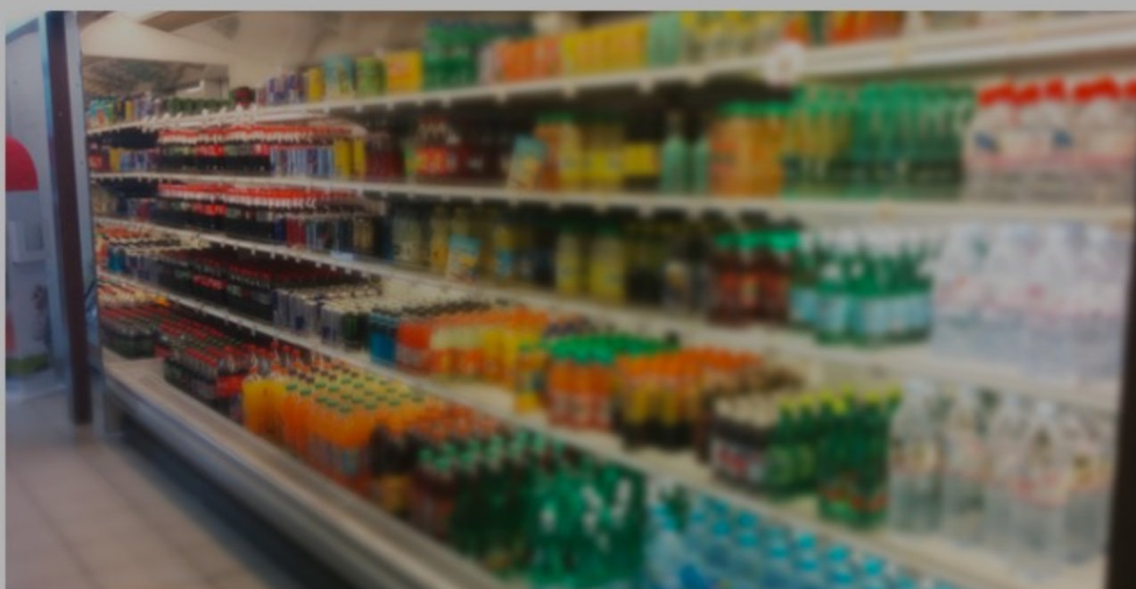
Rayon d'un supermarché au Maroc.

La campagne de boycott de certains produits de grande consommation est très plébiscitée par les Marocains. C'est le constat d'un sondage d'opinion réalisé par Averty, cabinet d'études de marché et de sondages d'opinion.