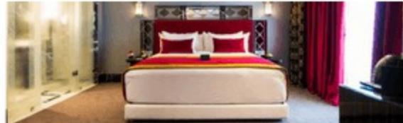
-LE CASABLANCA HOTEL CHAMBRES ET SUITES ART DECO AU CENTRE DE CASABLANCA